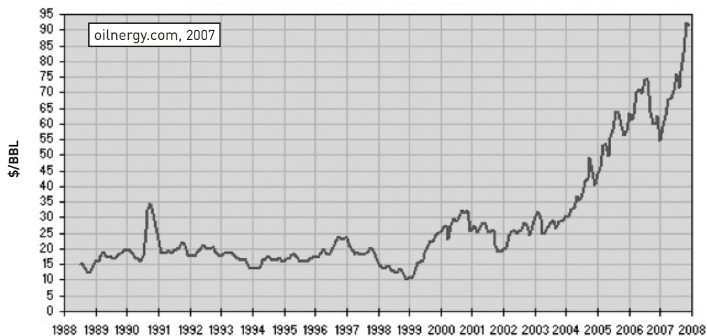
Gráfico 2 > Preço de fechamento do petróleo bruto ICE BRENT