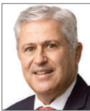
Nuno Severiano Teixeira , Président, Instituto Português de Relações Internacionais (IPRI), Universidade NOVA de Lisboa

l'autrice de publications scientifiques liées au droit de la mer, au droit de la plaisance et des bateaux, et aux organisations régionales de pêche. Auparavant, elle a travaillé pendant 4 ans pour l'Organisation des Nations unies pour l'alimentation et l'agriculture (FAO) en Afrique du Nord sur des projets de développement de la pêche tenant compte des questions de genre. Forte de son expérience dans la gestion de projets de développement, elle a aidé des OSC à se mettre en réseau et à monter des projets de développement sur plusieurs thèmes liés à l'adaptation et à l'atténuation. Elle est juriste en droit international et relations Maghreb-Europe et spécialiste du droit de la mer.